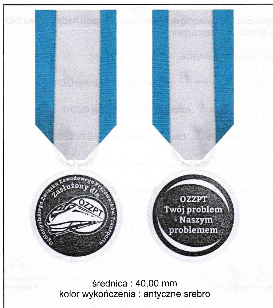
Rys. 1. Awers i rewers Medalu honorowego „Zasłużony dla Ogólnopolskiego Związku Zawodowego Pracowników Transportu”